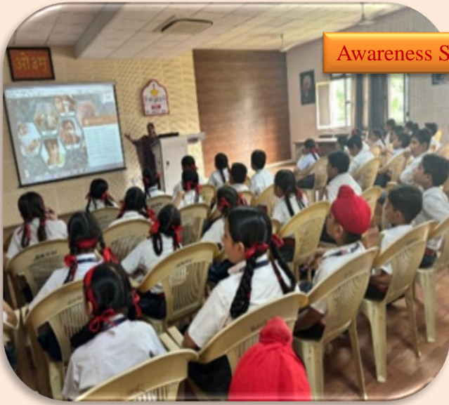
Awareness Session On Monsoon Diseases And Preventive Measures