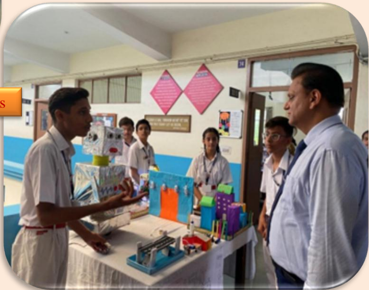
Maths And Science Exhibition Ignites Young Minds