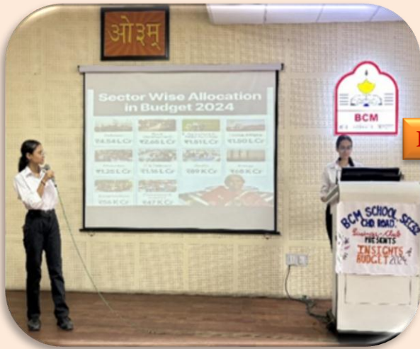
INTERACTIVE SESSION "INSIGHTS OF BUDGET 2024"