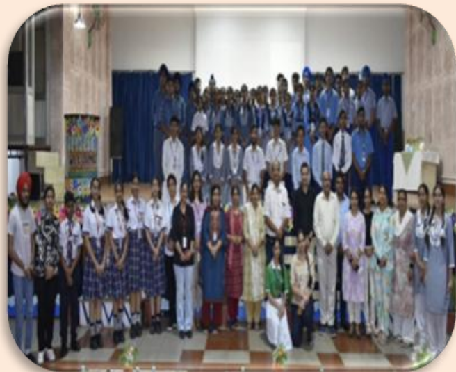
CAMPUS REPORTING WORKSHOP