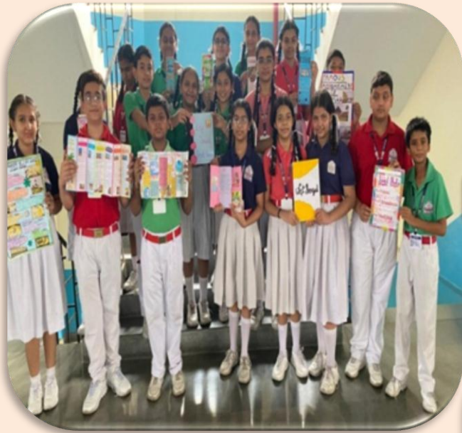
Swadesh Manthan: Unveiling Indian Heritage