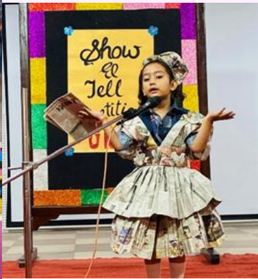
Show and Tell