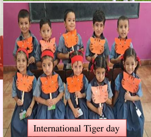
International Tiger day