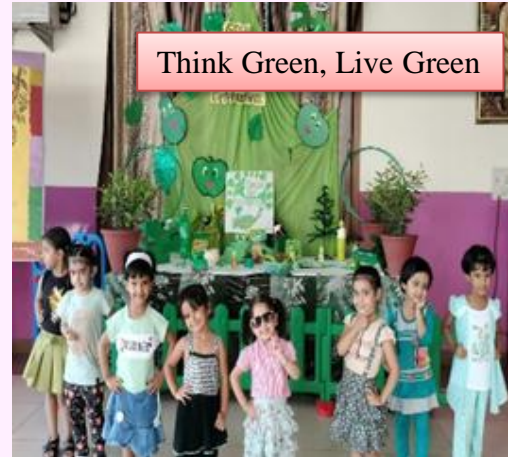
Think Green, Live Green