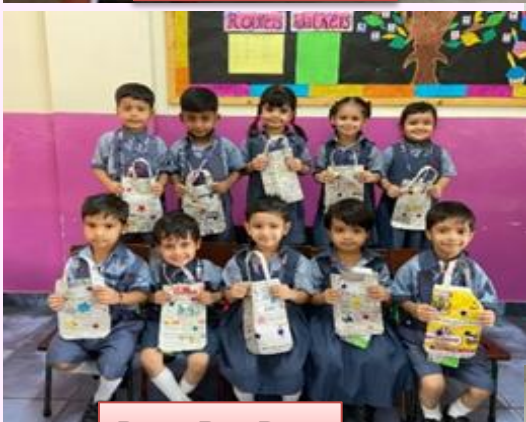
Paper Bag Day