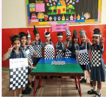
International Chess Day