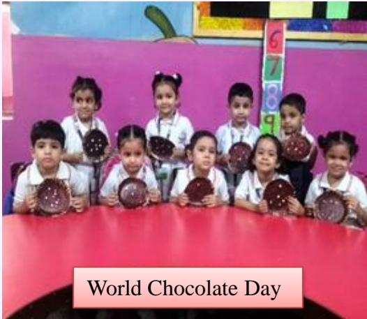
World Chocolate Day