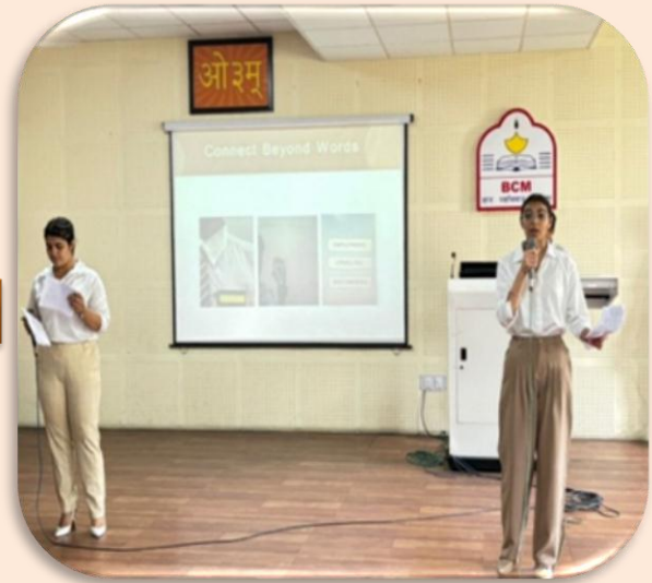
YOUNG ENTREPRENEUR- 2024