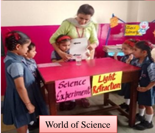
World of Science