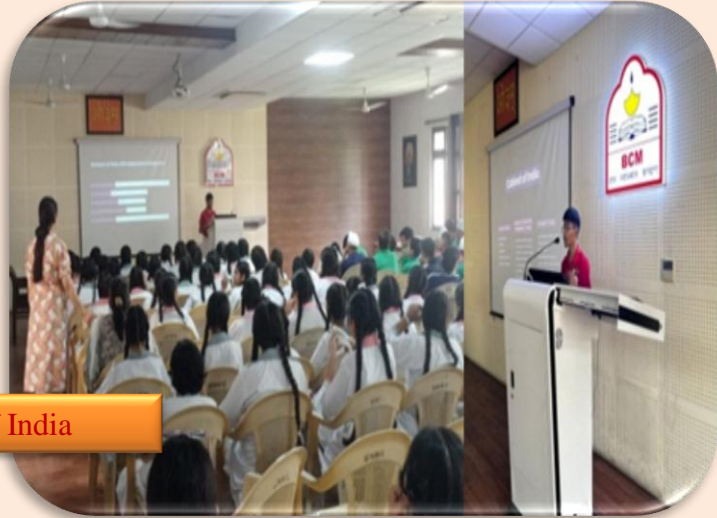
Understanding Governance: Present Cabinet Of India