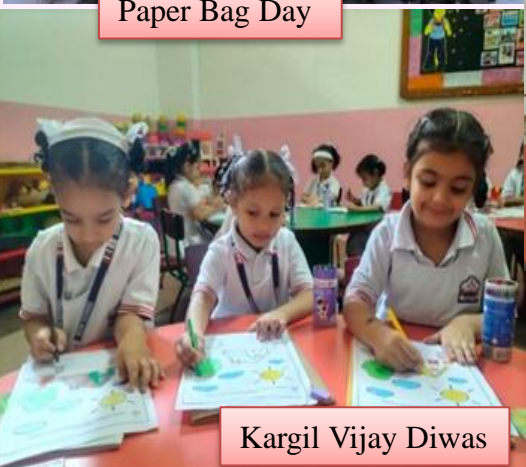
Kargil Vijay Diwas