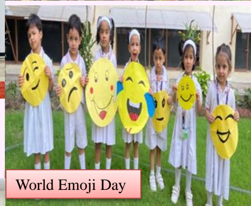
World Emoji Day